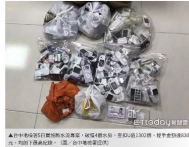
▲台中地檢署5日實施斷水流專案，破獲4個水房，查扣U盾1302個，經手金額達830億元，均創下最高紀錄。

社會 社會焦點 保險人維 選前「斷水流」！中檢偵破4水房 5年洗錢830億破紀錄